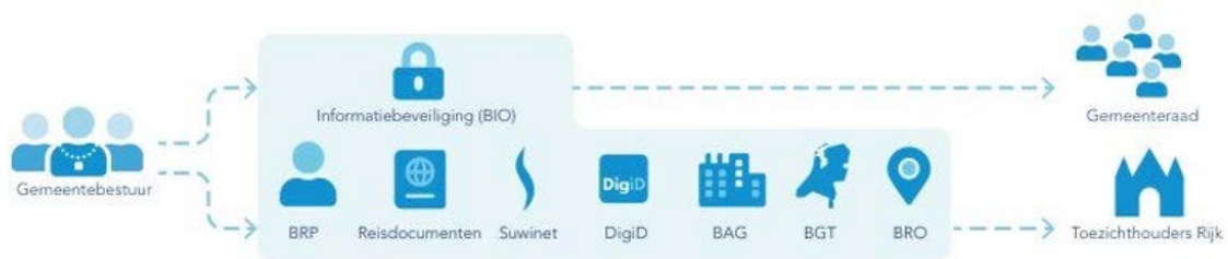
Figuur 2 Verantwoordingswijze gemeenten informatiebeveiliging

Specifiek voor de toegang tot elektronische dienstverlening wordt jaarlijks het DigiD-zelfassessment uitgevoerd. Ook deze valt onder het ENSIA-stelsel. De DigiD-audit wordt door een onafhankelijk auditor gedaan. In het verticale verantwoordingsproces wordt verantwoording aan Logius afgelegd met betrekking tot de aansluiting op DigiD. Logius stelt de regels voor de beveiliging en gemeenten moeten aantoonbaar voldoen aan deze regels. In onderstaande figuur 2 is de verantwoordingswijze weergegeven (naast DigiD, wordt er ook voor andere voorzieningen verantwoording afgelegd aan toezichthouders van het Rijk; die zijn voor dit onderzoek buiten scope). 11