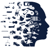
Tabel 5: Visuele weergave resultaten van de quickscan

De AP heeft in een quickscan de resultaten van een aantal Wpg audits bekeken. Hiermee heeft de AP een indruk gekregen van de mate van naleving van de Wpg over het gemeten tijdvak. De resultaten van 'de opzet' van een aantal rapporten zijn hieronder visueel in een tabel weergegeven.